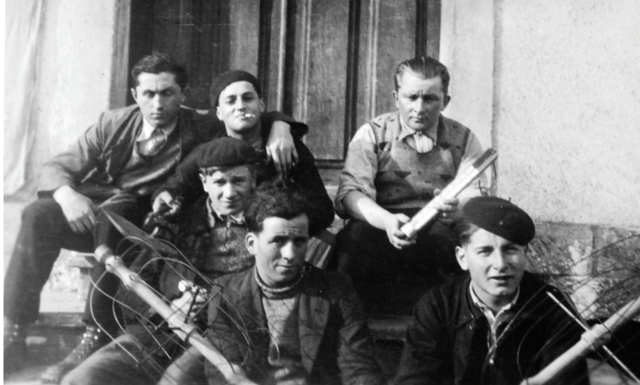
Elèves devant l'école fromagère de Bourg-Saint-Maurice modeste.

destinée à la formation des fromagers d'alpage. La structure va alors enseigner aux paysans locaux les procédés de fabrication mais aussi harmoniser le savoir-faire, tendant vers une texture « pâte pleine » et sans trou du produit fini. À noter que l'école cessa de fonctionner en 1966 faute de candidats. Et c'est également à cette époque qu'une fromagerie s'implante à Tignes, principalement pour l'hiver. La Société Fromagère de Tignes, et ses 32 sociétaires sont d'ailleurs indemnisés par EDF après la construction du barrage. En outre, celle-ci obtiendra par la suite des locaux situés aux Boisses.