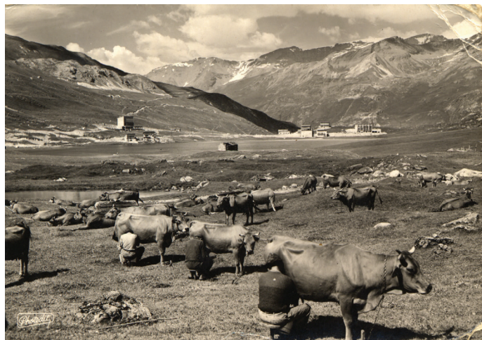
Vaches dans la vallée de Tignes, P. Fortier

La vie pastorale dans les alpes est organisée autour de l'unité d'exploitation que constitue la « montagne », terme utilisé pour désigner l'alpe. Dans les grandes montagnes où sont fabriqués les gruyères