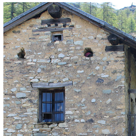
Double linteaux en bois sous la panne faitière.

Depuis l'entre-deux-guerres, avec le développement de la station et l'uniformisation des techniques de construction, ce patrimoine a parfois disparu, ou a été reconstruit avec des matériaux disparates. Plus récemment, à la fin des années 1970 est apparu un nouveau style se réclamant d'une architecture traditionnelle, mais plus fidèle à la vision fantasmée du touriste : le style «néo-montagnard», ou «néo-traditionnel». Cette mode, liée à une imagerie populaire du chalet savoyard confondu avec le Suisse et le Tyrolien, tend à mettre en scène la montagne. Par l'abus de parements de bois notamment, elle uniformise l'habitat, les villages, villes et stations de montagne, bien plus que les grands ensembles précédents, faisant perdre à ces lieux leur caractère et singularité.