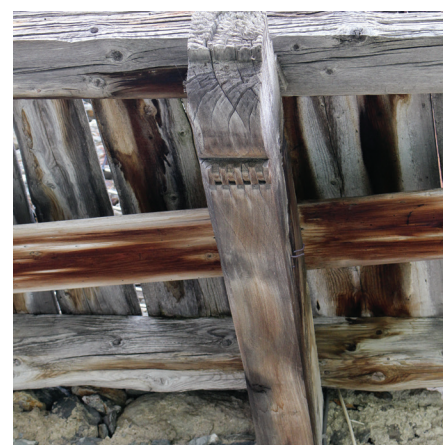
Détail d'une poutre dévoilant le travail de l'artisan