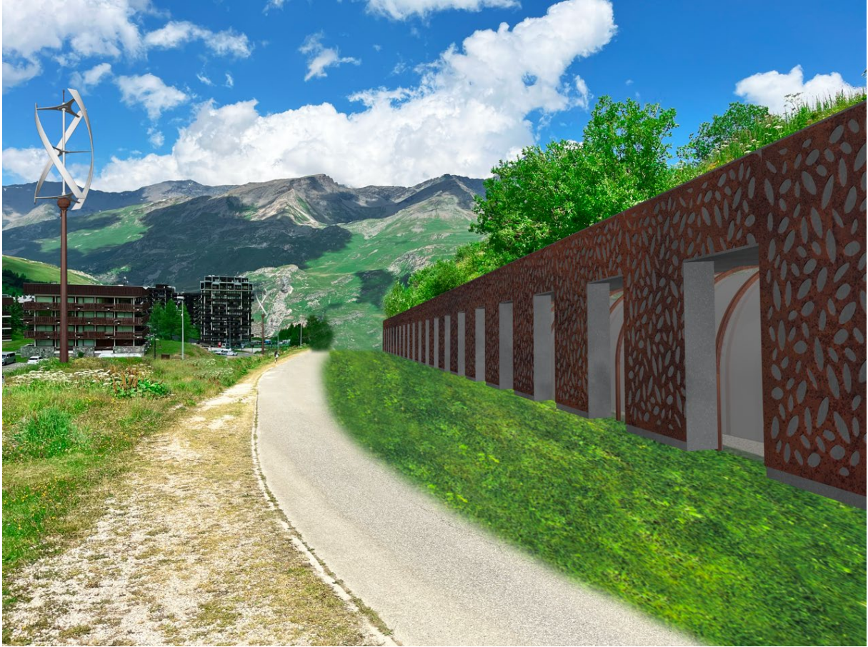
Idée d'insertion du tapis à la digue paravalanche