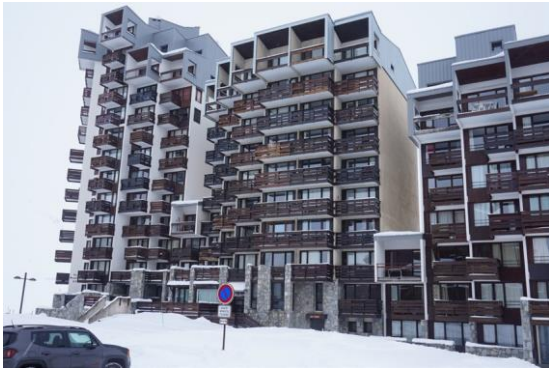
Vue sur les Moutières