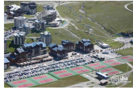
Vue sur l'avenue de Grande Motte

Le Site de l'OAP comprend l'ensemble du quartier du Val Claret au Sud de Tignes le Lac. Celui-ci est symbolique du développement de Tignes depuis l'essor des sports d'hiver à la fin du 20ème siècle, puisqu'il a été construit selon une volonté de produire une architecture novatrice. Ce centre urbain regroupe de nombreux commerces, des installations sportives (terrains de sport, terrain de mini-golf), des infrastructures de loisirs dont notamment le cinéma et le centre équestre, un office du tourisme, mais surtout une part importante de l'offre d'hébergement de Tignes. Le Val Claret s'ouvre sur le domaine skiable avec une large grenouillère laissant la possibilité de rejoindre le glacier de la Grande Motte.