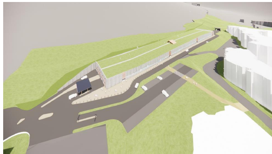
Projet de parking semi-enterré de la Boucle-Est du Val Claret

L'espace nouvellement créé après la mise en œuvre du parking "Boucle Est" du Val Claret permettra de réaliser un nouveau front de neige, support d'équipements sportifs et de loisirs.