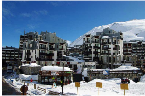
Vue de la rue du Val Claret sur l'immeuble Le Sefcotel